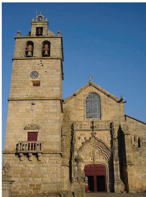
Figura 1. Igreja Matriz de Vila do Conde

À semelhança da construção da Igreja de Caminha, esta obra foi dirigida por sucessivos mestres-de-obras biscainhos . O primeiro terá sido João de Rianho, a quem sucedeu Sancho Garcia em 1500, substituído em 1509 por Rui Garcia, que era um dos pedreiros presentes já desde 1496, ou seja, desde o início da construção da Igreja de Vila do Conde (Freitas 1961a: 6-9; Freitas 1961b: 179-196).