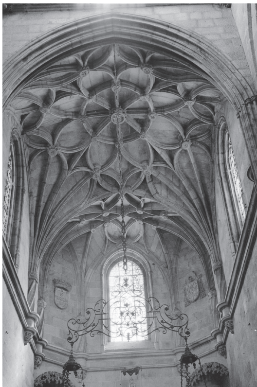
Figura 2. Capela mor da Sé de Braga

Para além das intervenções na Catedral, destaca-se ainda a eventual participação de biscainhos na construção das novas edificações que são construídas na Rua de S. João do Souto, mandada abrir por D. Diogo de Sousa com o objetivo de ligar a renovada capela-mor da Sé a uma das portas da muralha medieval. Entre o conjunto das novas edificações destacam-se a Casa dos Coimbras, edificada entre 1505 e 1512, bem como a Capela dos Coimbras, construída entre 1525 e 1528.