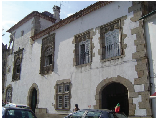
Figura 3. Casa dos Coimbras

A referida casa, que contou com a participação de vários artistas biscainhos , entre os quais, provavelmente o próprio João de Castilho, foi construída na Rua de S. João do Souto, tendo sido trasladada nos inícios do século XX para a sua localização atual, no Largo homónimo. Atualmente, apesar de algumas alterações operadas aquando da sua mudança, a Casa dos Coimbras denota ainda muitas características arquitetónicas e estilísticas originais (Vasconcelos 1995: 63-80).