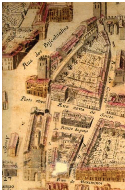
Figura 5. Vista da Rua dos Biscainhos (Mapa de Braga Primaz – 1755)