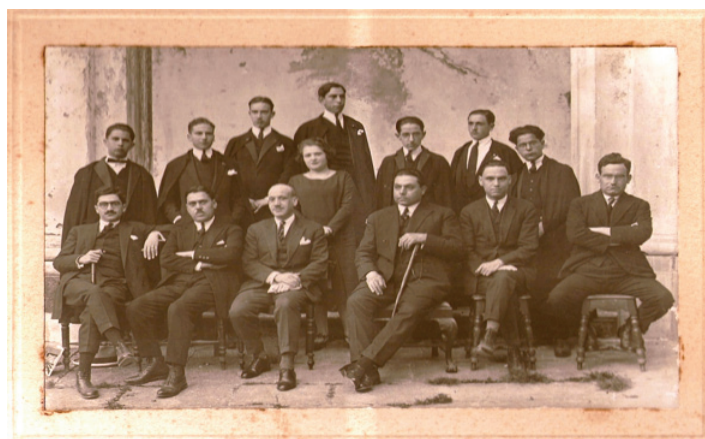
Ilustração 4. O corpo docente do Liceu de Portalegre no ano letivo de 1922/23