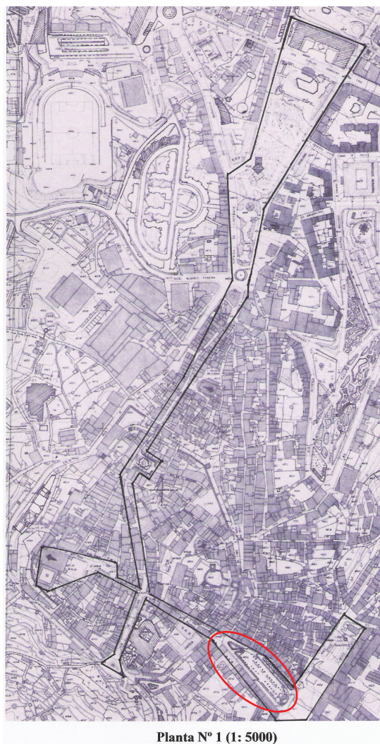
Ilustração 1. Planta nº1 da cidade de Portalegre (o espaço da Praça da República)

Este breve panorama demonstra que a requalificação e recuperação deste espaço foram pensadas para a cidade, como um todo, e não em função dos estudantes da ESEP. Estes, por uma razão ou por outra, adotaram a praça como essencial à sua vida académica. O convívio, a troca de ideias, os namoros, as refeições, as amizades e cumplicidades crescem e criam-se fora da ESEP, que fica quase limitada ‘ao local onde são ministradas aulas’, onde se fazem algumas fotocópias e se recorrem aos meios informáticos e documentais.