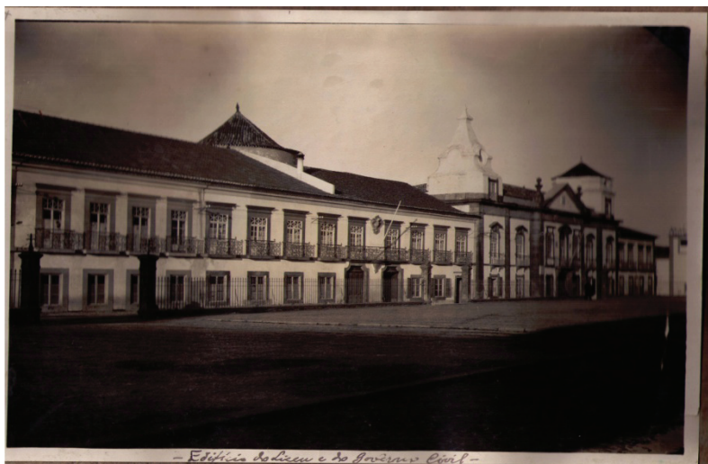
Ilustração 3. O Liceu de Portalegre (1928)