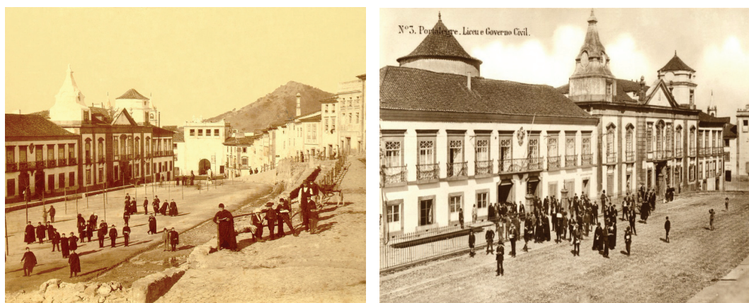
Ilustração 2. A Praça da República, o Liceu de Portalegre e o Governo Civil (1888/ década de 20)